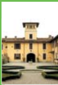
Lonate Pozzolo: Villa Porro