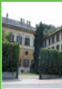
Induno Olona: Villa Castiglioni