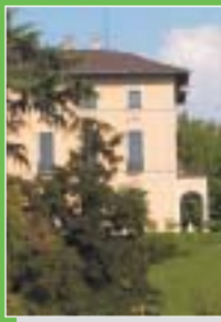
Varese: Villa Montalbano Esengrini