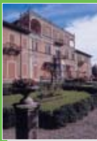
Gazzada Schianno: Villa Cagnola