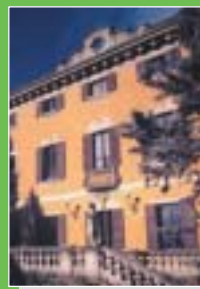
Induno Olona: Villa Porro Pirelli