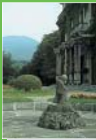
Casciago: Villa Castelbarco