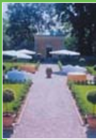
Cassano Magnago: Villa Buttafava