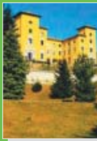
Tradate: Villa Sopranzi

parco pubblico / public park, luogo di mostre e incontri culturali, parco con reperti botanici / exhibitions and cultural events, park with botanic findings