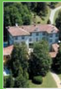
Carnago: Villa Bregana