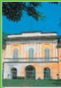
Laveno Mombello: Villa Frua