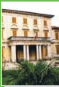
Viggìù: Villa Borromeo