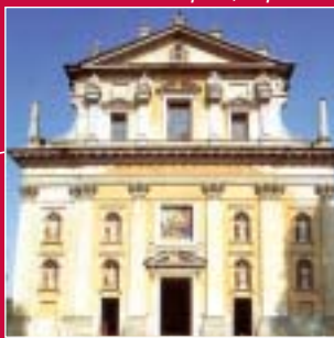
Foto: 6. Arsago Seprio: Collegiata di S. Vittore 7. Somma Lombardo: Madonna della Ghianda 8. Santa Caterina del Sasso: Eremo