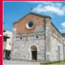
Gallarate Chiesa di San Pietro