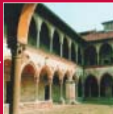
Cairate Il Monastero