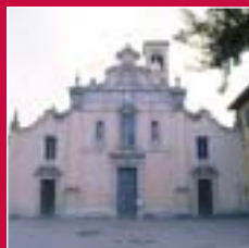
Saronno Chiesa di San Francesco