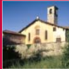
Brunello Santa Maria Annunciata