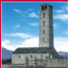
Cantello (Ligurno) Madonna in Campagna