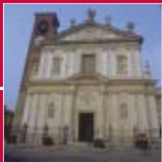
Busto Arsizio Chiesa di San Michele