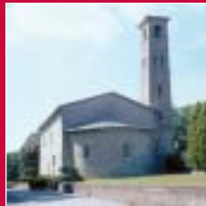
Varese Chiesa di Santo Stefano