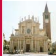
Busto Arsizio Basilica di San Giovanni