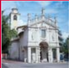
Varese Chiesa Madonnina in Prato

a seconda delle esigenze dei gruppi, è possibile modificare gli itinerari e concordare le celebrazioni religiose. Depending on the demands of the groups, itineraries can be modified and religious celebrations agreed upon.