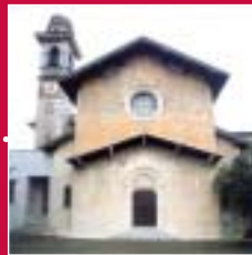
Caravate Santa Maria del Sasso