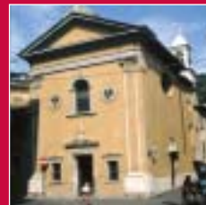
Viggiù Madonna della Croce