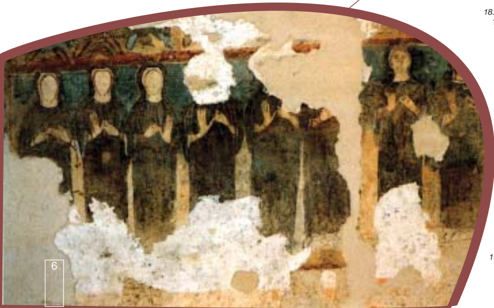
Foto di Gornate Olona (Torba): 17. Torre 18. Monastero 19. Affresco

This site served originally as a safe bulwark for the garrisons that occupied it through the centuries. Towards year 1000 it was transformed into a sacred place where some Benedictine nuns installed themselves, making Torba a welcoming site for pilgrims travelling the road along the Olona banks. The tower with its interesting frescoes and the now deconsecrated church dedicated to Santa Maria are all that remain of the monastic period. In 1976, the complex was acquired by the Italian Environment Fund, which then started restoration works, safeguarding the buildings and bringing new life to the entire complex. The Church of S.Michele Arcangelo is also to be found in Gornate Olona, one of the most ancient oratories of the province, with interesting paintings clearly recognisable as late Roman and Medieval art; within the church, pictorial works that span from the XVI to the XVIII century are to be seen. In the same area are the mills of S.Pancrazio (1772), that remained in operation until the late fifties.