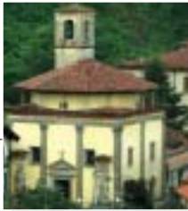
Foto di Castiglione Olona: 2. il borgo 3. Chiesa di Villa 4. Cardinale Branda Castiglioni

The visit to the village can begin with the Chiesa di Villa, the town centre's church, also named SS. Corpo di Cristo, a unique example of humanistic-inspired building with a remarkable cylindrical cupola, housing XV century works.