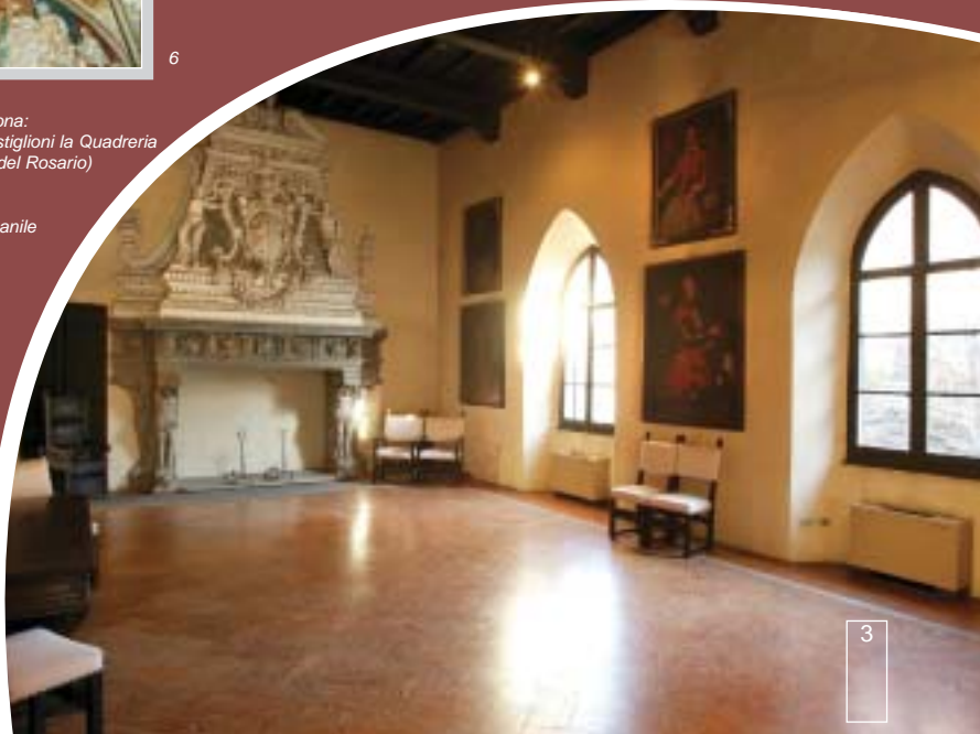
Foto di Castiglione Olona: 5. Palazzo Branda Castiglioni la Quadreria 6. La Collegiata: ( BV del Rosario) Storie della Vergine 7. Collegiata: abside 8. La Collegiata: campanile